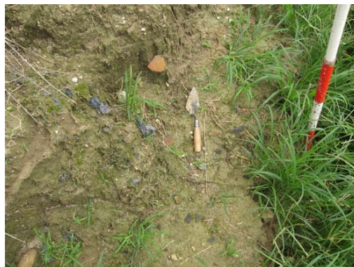
圖說：散落於田埂斷面的夾砂紅陶