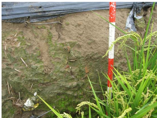
圖說：田埂斷面出土的夾砂紅陶